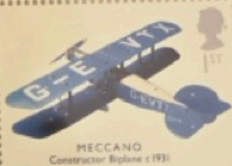
MECCANO Constructor Biplane c.1931