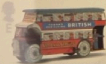
WELLS-BRIMTOY Clockwork Double-decker Omnibus c.1938