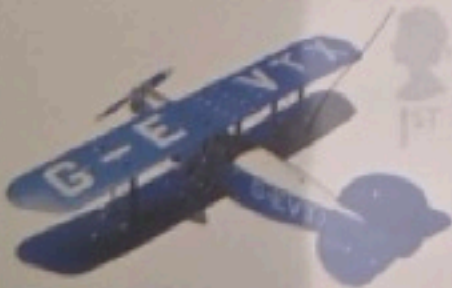
MECCANO Constructor Biplane c1931