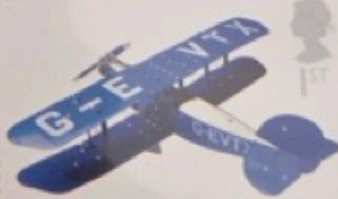
MECCANO Constructor Biplane c1931