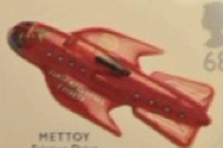
METTOY Friction Drive Space Ship Eagle c.1960