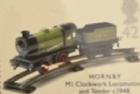
HORNBY M1 Clockwork Locomotive and Tender c.1948