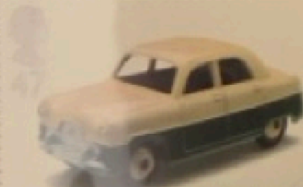
DINKY TOYS Ford Zephyr c.1956