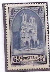
CATHÉDRALE DE REIMS