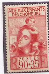
ENFANTS DES CHOMEURS