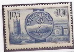
VISITE DES SOUVERAINS ANGLAIS