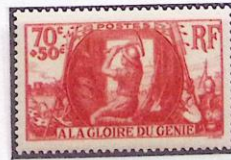
A LA GLOIRE DU GÉNIE