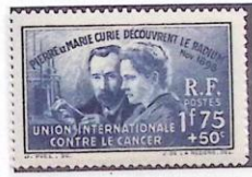
PIERRE ET MARIE CURIE