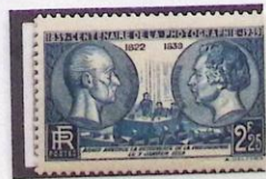
CENTENAIRE DE LA PHOTOGRAPHIE