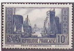
PORT DE LA ROCHELLE