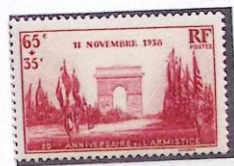
20° ANNIVERSAIRE DE L'ARMISTICE