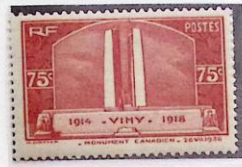
MONUMENT DE VIMY