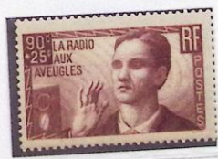
LA RADIO AUX AVEUGLES