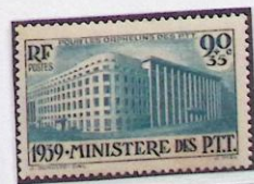
MINISTÈRE DES P. T. T.