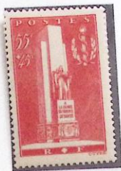
MONUMENT DE LYON