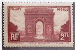
ARC DE TRIOMPHE