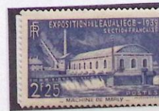
EXPOSITION DE L'EAU A LIÈGE