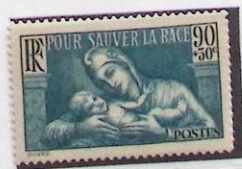
POUR SAUVER LA RACE