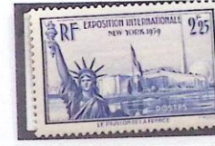
EXPOSITION DE NEW-YORK