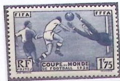
COUPE DU MONDE DE FOOTBALL