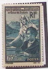
POUR LES ÉTUDIANTS