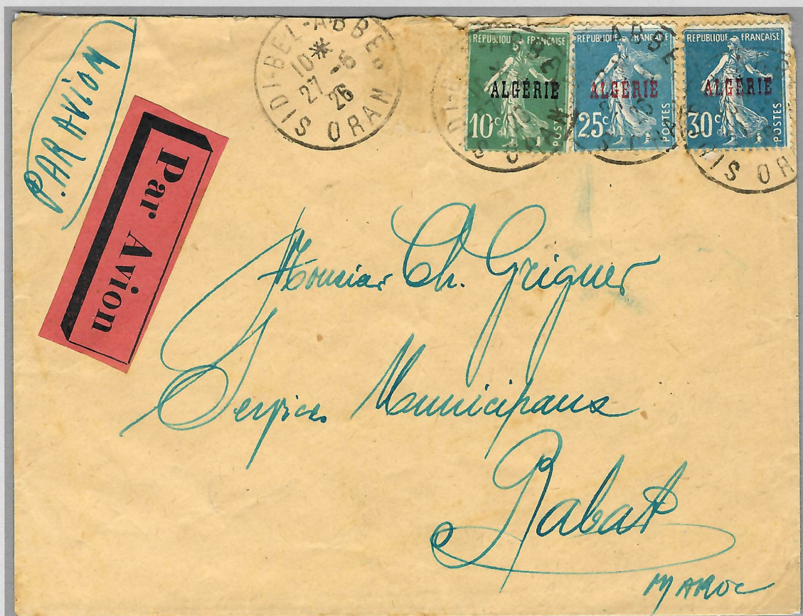
Sidi-Bel-Abbès 27 mai 1926, pour Rabat, arrivée le 30, tarif du 25 mars 1924 = 25 c. + taxe avion du 6 octobre 1922 = 25 centimes.