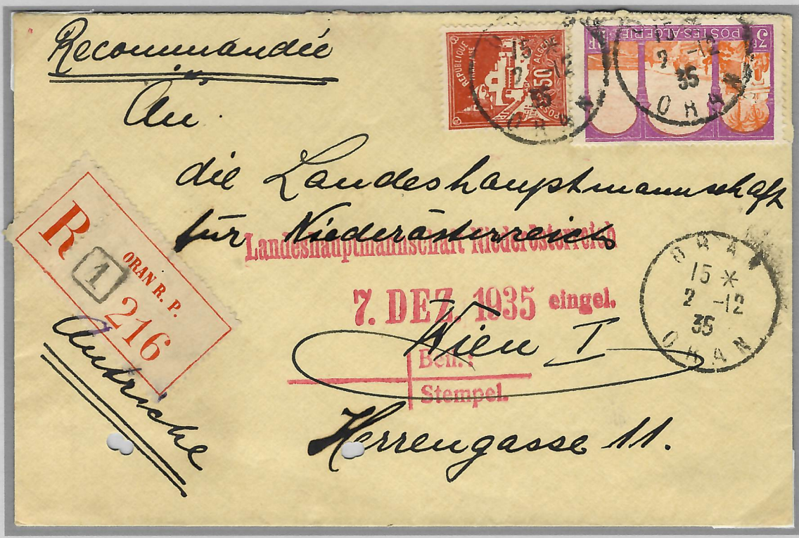
Destination Autriche : Oran 2 décembre 1935, tarif UPU du 1 er août 1926 = 1.50 fr. et recommandé = 1.50 fr.