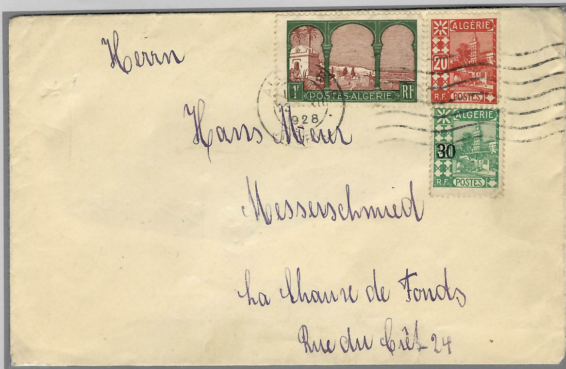
Destination Suisse, Alger-R.P., 12 décembre 1928, port 1.50 fr. tarif UPU du 1.8.1926.