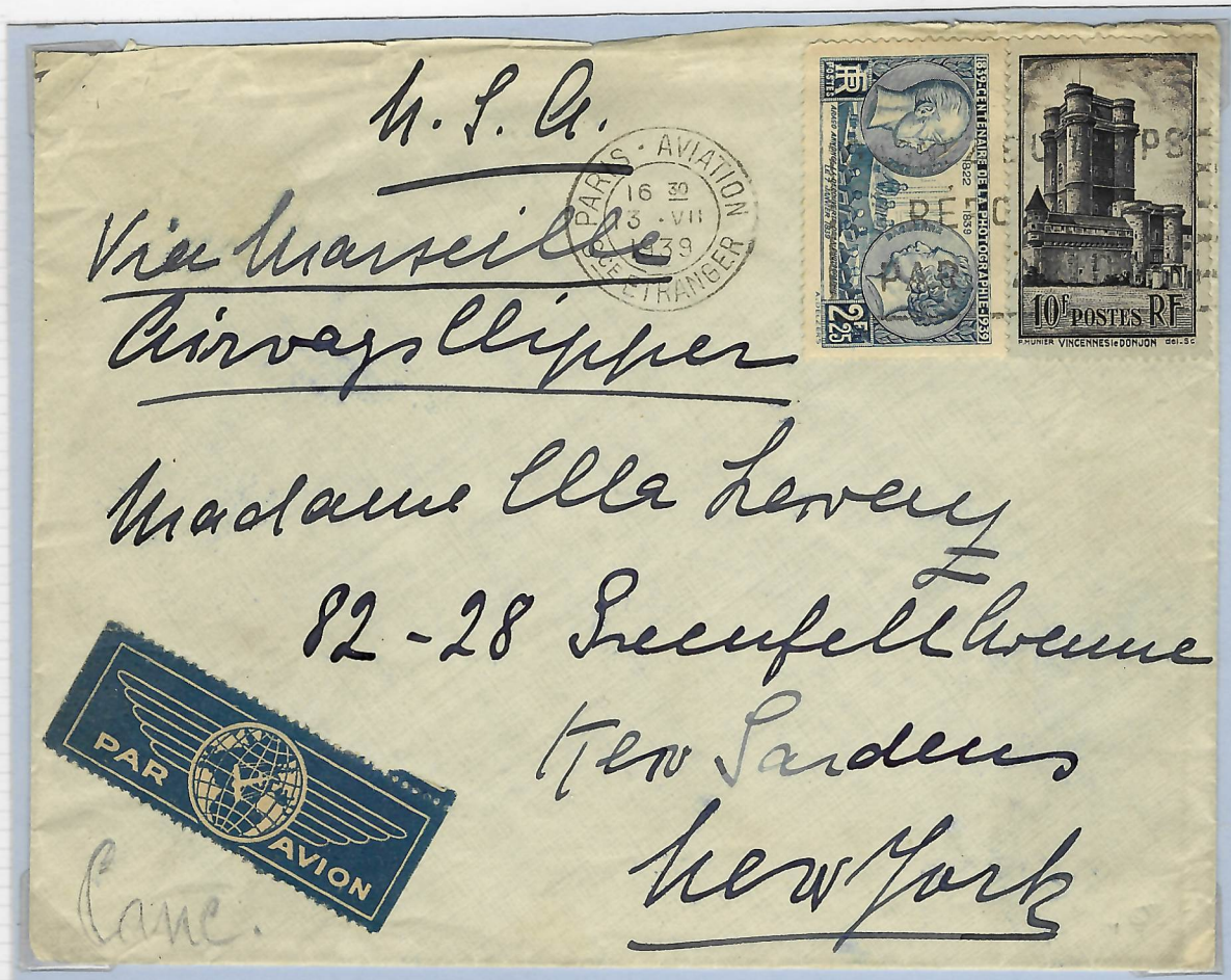
Lettre par « Avion » 5 e échelon pour New York via Marseille, Airways Clipper. Obl. de départ « Service étranger, Paris - Aviation - 3-VIII-1939 ».