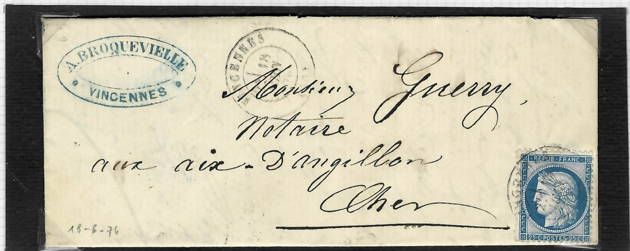
Lettre pour Aix-d'Augillon (Cher), Vincennes, 18 juin 1876.