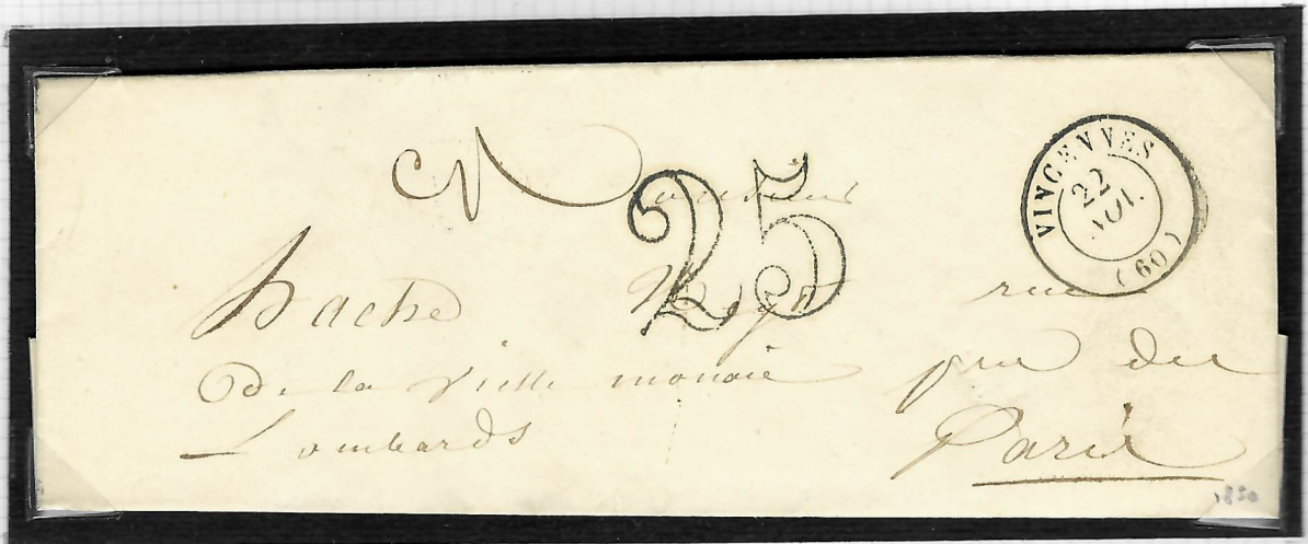
Lettre taxée pour Paris, Vincennes, 22 novembre 1850.