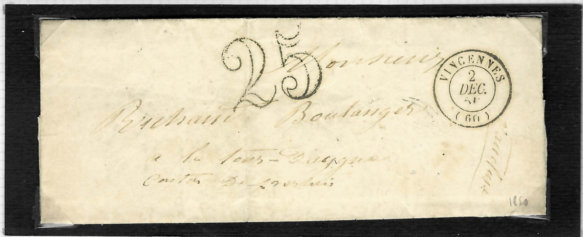
Lettre taxée pour la Tour-d'Aigues (Vaucluse), 2 décembre 1850.