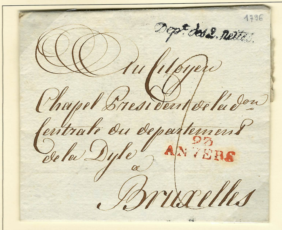
Lettre du 17 Brumaire an V (7 novembre 1796) du Commissaire de l'administration centrale du département. Marques postales : en noir, le cachet du département, en rouge, la marque de départ de la poste, et, manuscrite, la taxe d'acheminement de 2 décimes