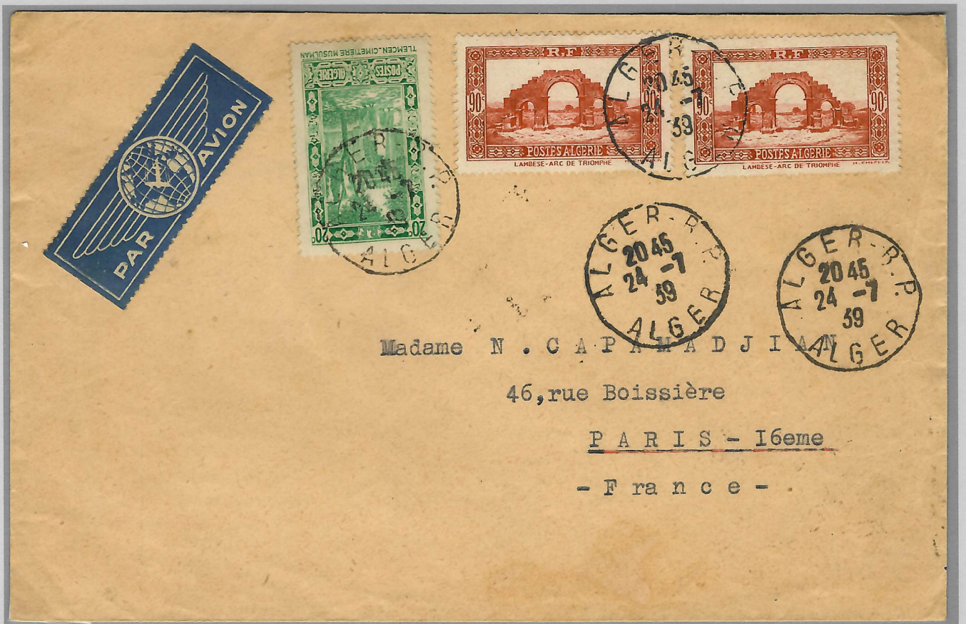
Alger 24 juillet 1939, pour Paris, mêmes tarifs.